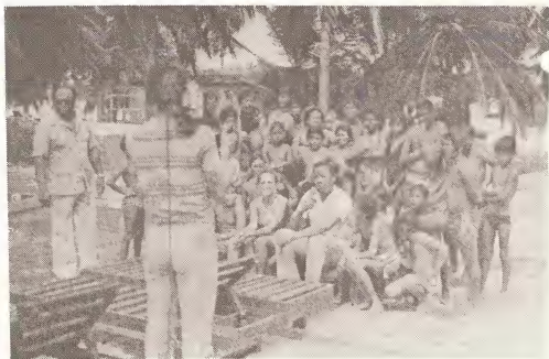
Programma Vacacional 1982

Na April 1980, Gobierno di Aruba a cambia e nomber di Sportbureau den